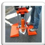
Le poids de l'opérateur assure un bon maintien