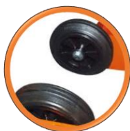
Roue de transport inclus