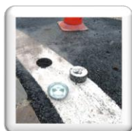
Carottage pour plots routier rétroréfléchissants jusqu'au Ø 280 mm