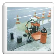
Carottage pour bouches à clé jusqu'au Ø 280 mm