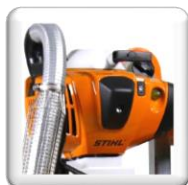
Moteur STIHL FS560 2,8 kW (3,8 Cv) 300 min-1