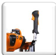
Poignet de Gaz Homme mort