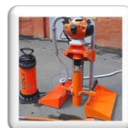
Carottage pour prélèvement d'échantillons