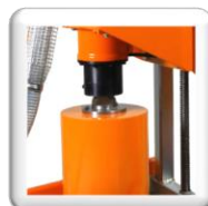
Emmanchement, Bride 3 trous