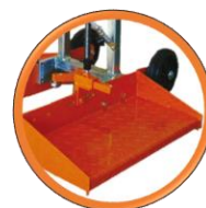
Jeu de Marchepieds inclus

Carotteuse GÖLZ KB200 électrique avec moteur thermique STIHL FS560, pour prélèvement d'échantillons dans le béton & l'asphalte, pose de mobilier urbain & travaux routiers.