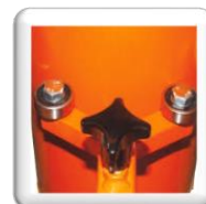
Guide Couronne Carottage du 50 au 208 avec guides et jusqu'au 280 sans les guides