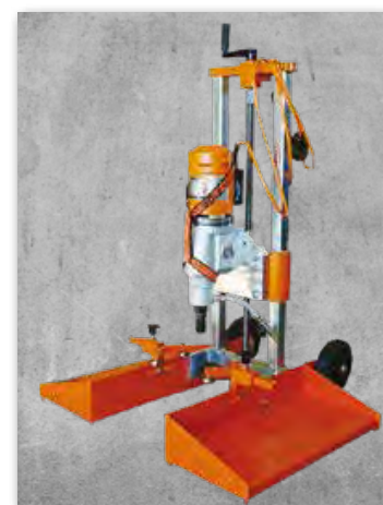
KB200 version électrique Moteur Bender BBM33L-extra

Pince d'extraction non comprise dans l'équipement standard (Voir tableau accessoires ci-contre)