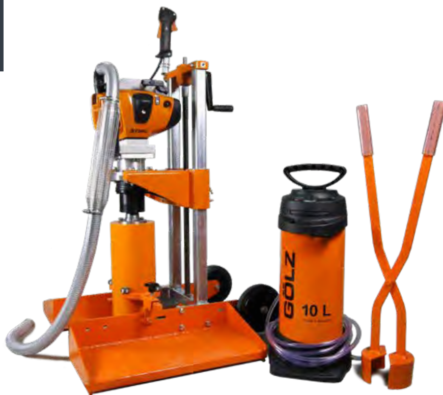
KB200 version thermique Moteur STIHL 2 temps